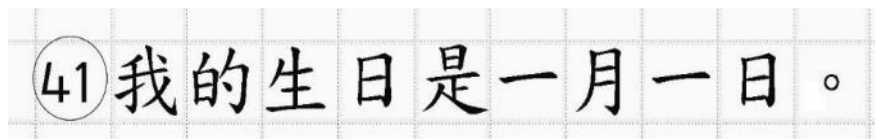
Рис.14. Образец написания иероглифических знаков

иероглифический знак и каждый знак препинания следует писать внутри отдельной клетки области ответов бланка ответов № 2 (дополнительного бланка ответов № 2) (рис. 14).