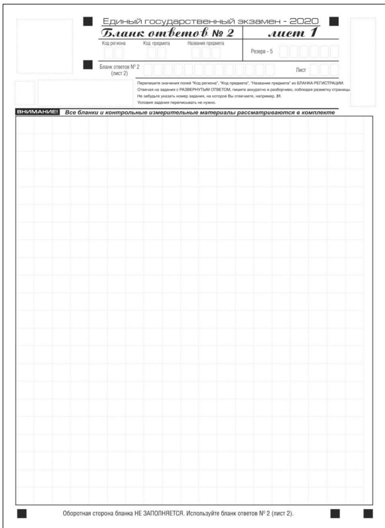
Рис. 12. Бланк ответов № 2 по китайскому языку (лист 1)