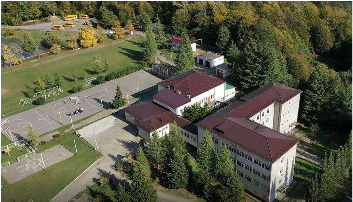
Современное здание школы

В 1987 г. было сдано в эксплуатацию новое школьное здание на 464 места. В 90-ые годы школа приняла много новых учеников из числа беженцев из Абхазии, Армении. Были открыты 37 классов-комплектов, обучалось около 800 чел.