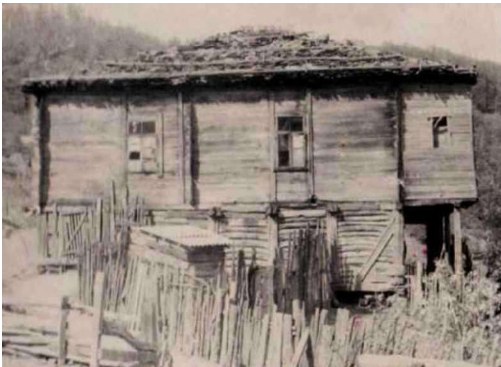
Первая школа с. Сергей-Поле, 1915 г.

Село Сергей-Поле основано в 1913 г. беженцем из Турции. Уже через два года в 1915 году была открыта школа. Это было деревянное здание с двумя комнатами-классами. Учил детей один учитель.